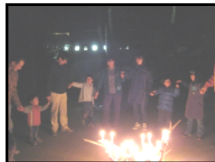
キャンドルファイア