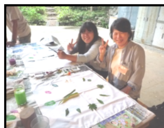
葉っぱのハンカチ