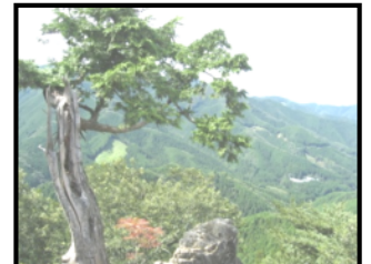
伊豆ヶ岳ハイキング