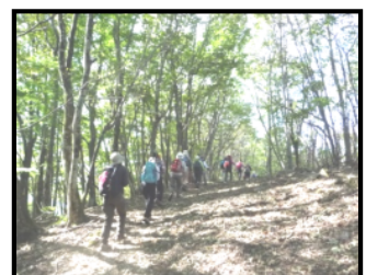
武川岳ハイキング