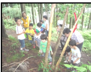
森のビンゴゲーム