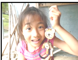
木の人形“キコリン”