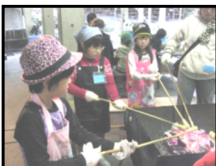
ミニバウムクーヘン