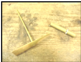
竹とんぼ・よびこ笛