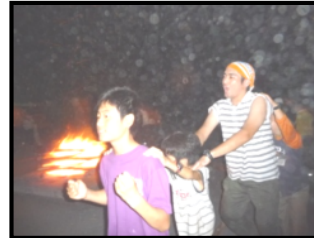
キャンプファイア