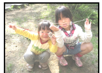
ぶんぶんゴマ・木の名札