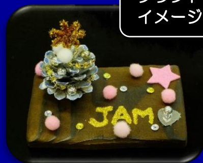
クラフト イメージ