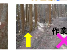
作業道 左の道を行く