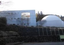
本館・プラネタリウム