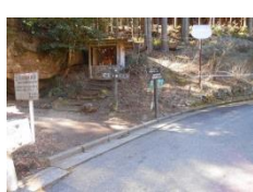
馬頭様を左に入る