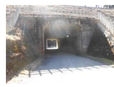
電車のガードをくぐる