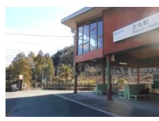
改札口右の階段を下る