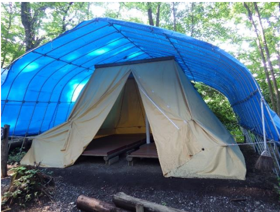
常設テント（定員 8 名）

【問合せ先】埼玉県立名栗げんきプラザ 〒357-0111 飯能市上名栗 1289-2 TEL:042(979)1011 FAX:042(979)1013 メール:naguri@tokyu-com.co.jp