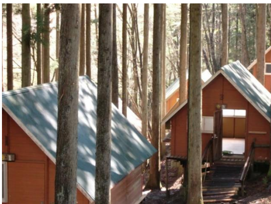
バンガロー（定員 6 名が 1 棟、その他は定員 10 名）