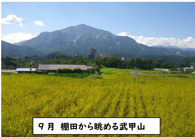
9月 棚田から眺める武甲山

この度は、埼玉県立名栗げんきプラザ主催事業「寺坂棚田で米作り」にお申し込みいただき、ありがとうございます。本事業は6月の田植えから始まり、9月の稲刈り、11月の収穫祭と、約半年の間に様々な農作業を通じて「食育」「農業の苦楽」「棚田の自然」を体感して頂けるものです。以下、参加の手引き（総合）をご覧いただき、事前手続きの流れと概要をご確認ください。