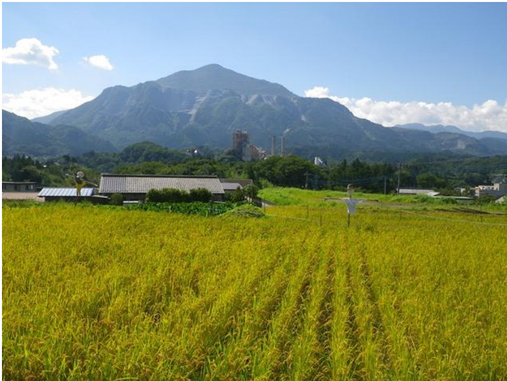
棚田から眺める武甲山

今日では希少になった命あふれる「棚田」の豊かな環境を感じて楽しく、のびのび、ゆったりとした時間を過ごしましょう。