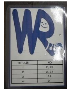
ウォークラリー看板