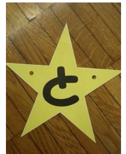
ウォークラリーの星看板